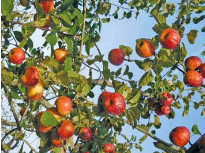
Neben dem Wetter muss auch die Pflege stimmen

Anmeldung: wegen begrenzter Teilnehmerzahl bis 22.02. per E-Mail an info@artefact.de